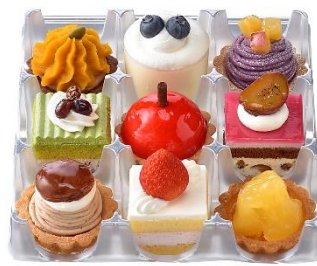
プチセレクション～楓葉～（9個入）