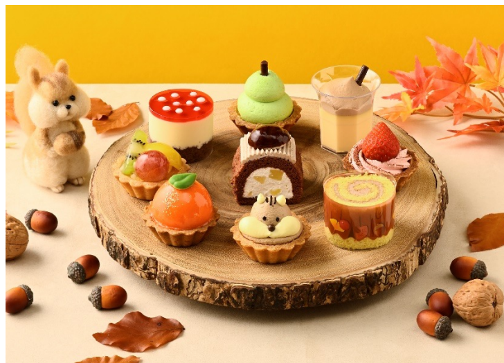
▲ウッドボードに並べたプチケーキ9個のイメージ。写真左奥のフェルトのリスは、当商品の企画開発担当者が作成。ストーリーや挿絵、キャラクターなどの制作もすべて当社社員が手掛けています。

「リスの冬じたく」の物語を1枚の絵本風リーフレットにしました。お話とプチケーキがページごとに載っており、みんなで物語を読みながらプチケーキをお楽しみいただけます。