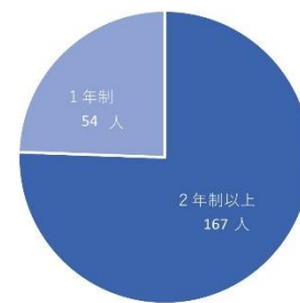
留学生在籍年数内訳

1年制でも調理師免許は取得できますが、より専門的な調理技術を習得するために、2年制以上の課程に在籍する留学生が4分の3を占めています。