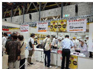
前回の最終審査で 雑煮を販売する様子