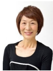
浜内千波 料理研究家・ 食プロデューサー