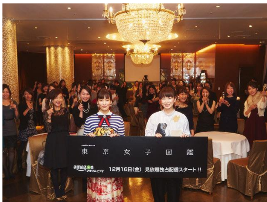
代官山のレストランで開催した完成披露試写パーティの様子

※東京女子図鑑 (Amazon プライム・ビデオ)： https://www.amazon.co.jp/b/?node=3535604051