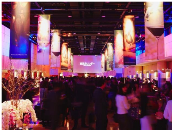
東カレ読者 300 名を招待した六本木での大ワインパーティーの様子。22 社の山梨ワイナリーが集結

今後も“大人の社交場”をテーマに出会いとグルメを楽しむイベントを企画・開催する予定です。