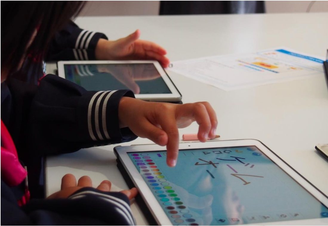
(体験授業でのゲーム開発の様子)