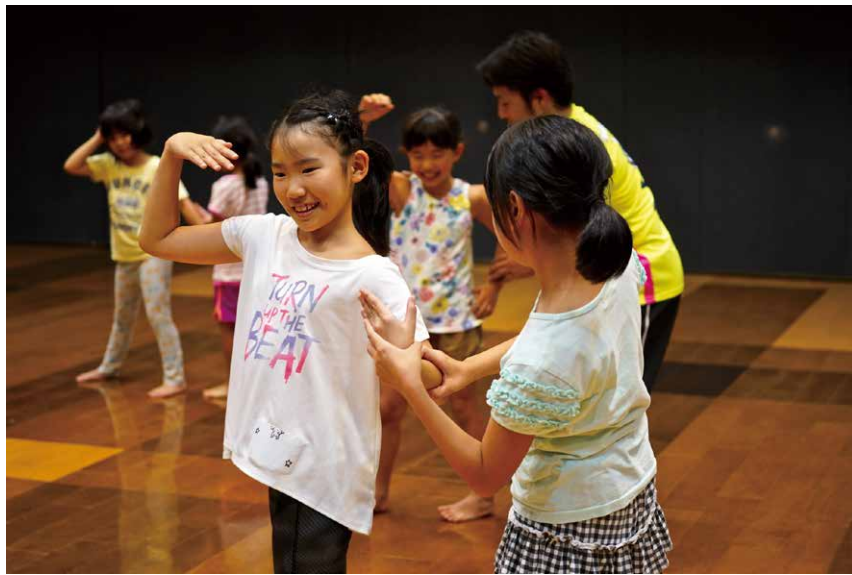
プロジェクトイメージ写真 (さいたまスーパーアリーナの青少年育成事業 身体表現ワークショップ「チームたまーりん」より)

今般、以下の地域において、いよいよプロジェクトを開始しますので、概要をお知らせします。