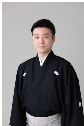
(左)ADD国立市 ワークショップ風景©植田洋一 (右)尾上菊之丞