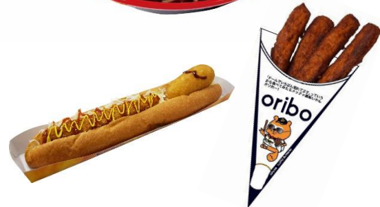
< 特別コラボレーションメニュー イメージ >

LMは、「Ponta」の「便利・おトク・楽しい」世界が、いつでもどこでも広がる生活密着型サービスを提供しています。キャラクター「ポインタ」の展開を通じて、その世界を幅広い世代の皆様にお伝えし、「Ponta」への親しみを感じていただくことを目指しています。