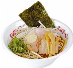
ポンタのポンコツラーメン ～醤油味だよ～ 700円