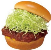
ポンカツバーガー 480円 (オリジナルステッカー付)