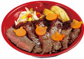
ポンタ 勝利のステーキ丼 ～おりほー！～ 限定10食/ 2,500円 (ポンタ撮影会参加券付)