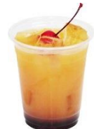
ポンタオレンジ (カシス風味) アルコール 650円 (オリジナルステッカー付)