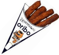
oribo (オリポー) 500円 (オリジナルステッカー付)