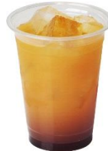
ポンタオレンジ (カシス風味) ノンアルコール 500円 (オリジナルステッカー付)