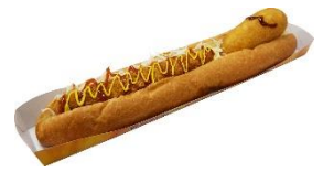
いてまえポンカツドッグ 950円 (オリジナルステッカー付)