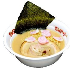
ポンタのポンコツラーメン ～しょうゆとんこつ味だよ～ 700円