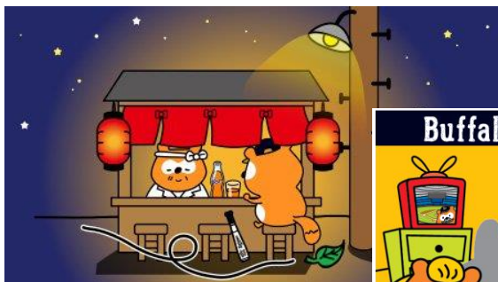
公式Twitterで話題となったあの居酒屋のシーンを再現