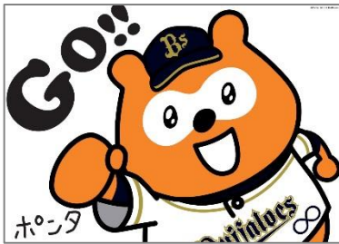
応援フラッグ (紙製) ・表