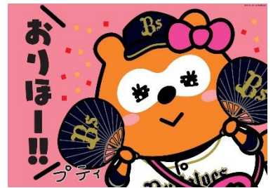
応援フラッグ (紙製) ・裏 ※4デザインのうちいずれかをプレゼント