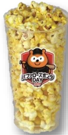
ポンポップコーン 【チーズ味】 500円