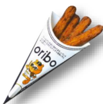
oribo (オリボー) 500円