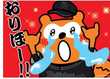
おめでとうミニポスター ※どちらか1枚をランダムでプレゼント オリックス・バファローズが勝ったら、みんなで掲げよう!