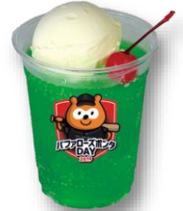
ポンチャソーダ 【メロンクリームソーダ】 500円