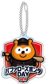
バファローズポンチャDAY ロゴアクリルキーチェーン 800円