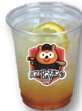
ハニポンレモンチューハイ 【※アルコール】 600円