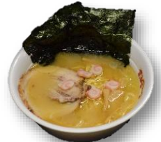
ポンチャのポンコツラーメン ～みそ味だよ～ 750円