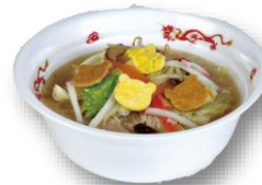
ポンちゃんめん 800円