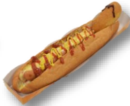
いてまえポン勝つドッグ 1,000円