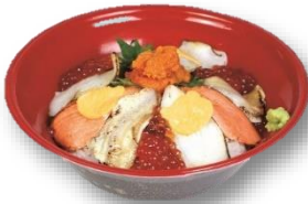
炙り海鮮ポンチャ丼 限定10食 / 2,300円 (ポンチャ撮影会参加券付)