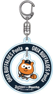
バファローズポンチャ ふりふりアクリルキーホルダー(全2種) 各800円