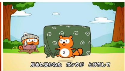
ポインタ、力になりたい