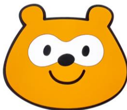
Pontaラバーコースター (にっこり)