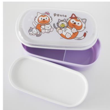
ポンタランチボックス