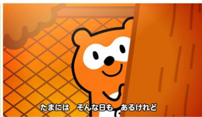
ポインタとパパ～男はつらいよ～