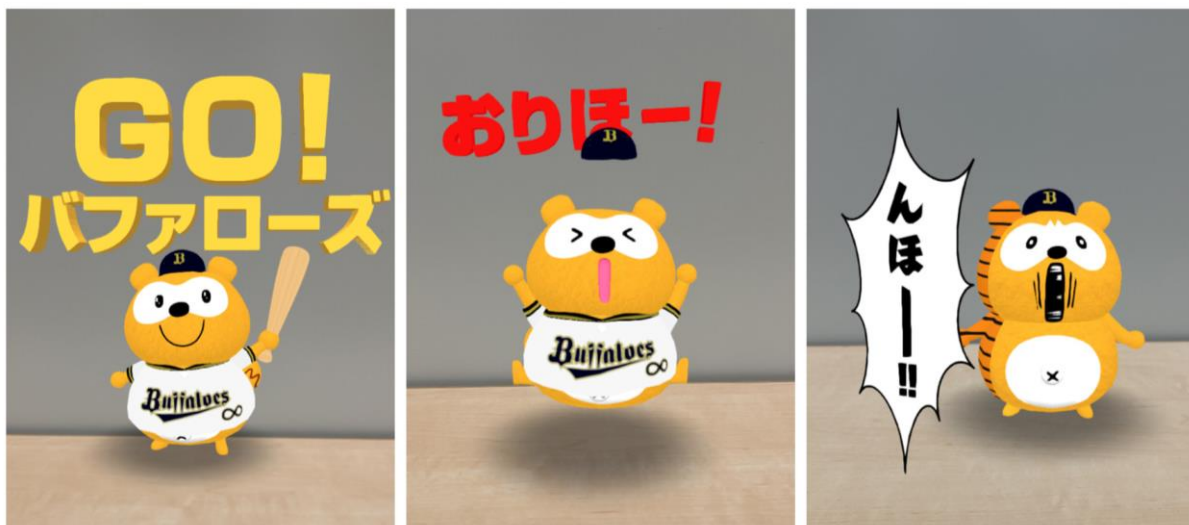
ARフィルターのイメージ (3種類から選択いただけます)

AR フィルターページ : https://www.instagram.com/ar/896333728361040/