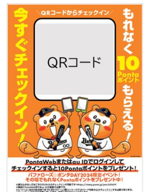
対象ポスター イメージ