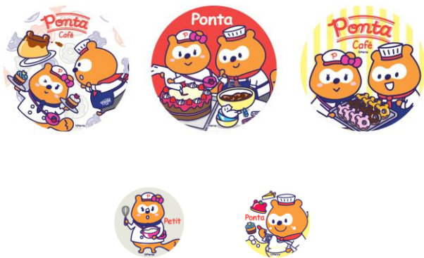
商品名：缶バッジ (大) 価格：各 500 円(税抜)