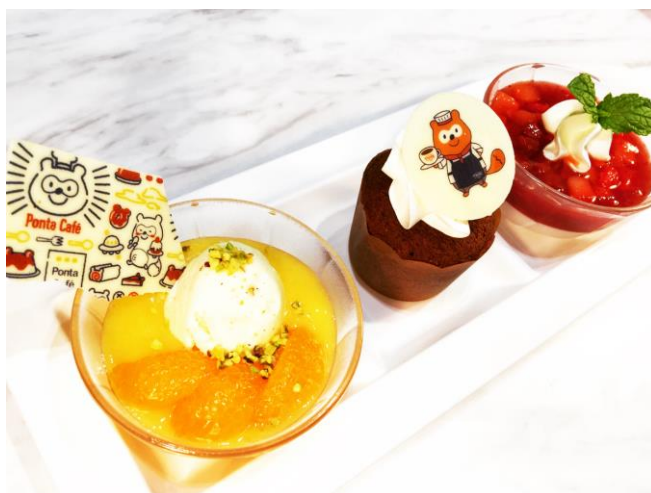
シルブプレート : 800円 (税抜)