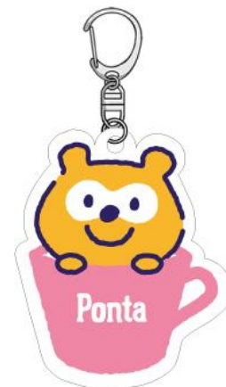
商品名：アクリルキーホルダー 価格：600 円(税抜)