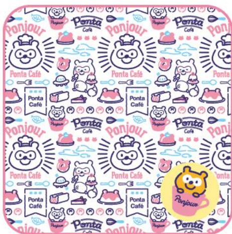
商品名：ハンドタオル 価格：600 円(税抜)