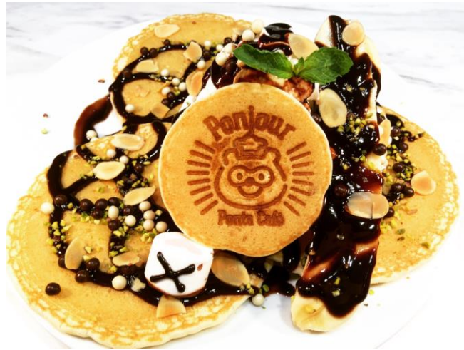
チョコバナナポンケーキ : 1,200円 (税抜)