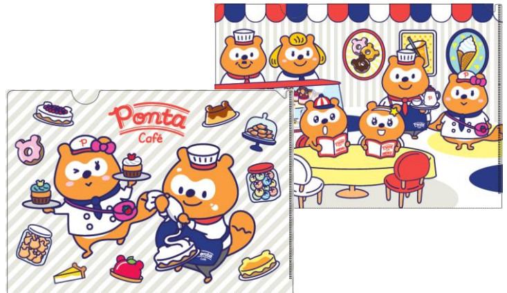
商品名：A4 クリアファイル 価格：各 400 円(税抜)