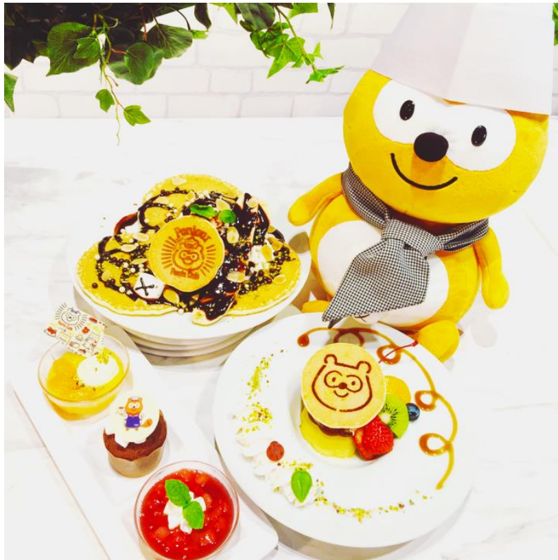
【オリジナルメニューイメージ】

株式会社セガ エンタテインメントは、本日、「KidsBee ららぽーと立川立飛店」にて、株式会社ロイヤリティ マーケティングが運営する共通ポイントサービス「Ponta (ポンタ)」のサービスキャラクター「ポンタ」の世界観をイメージした“ポンタカフェ”「Ponjour (ポンジュール)」のコーナーをオープンいたします。「Ponjour」では、今回特別にご用意したオリジナルメニューのスイーツ3種、新デザイン2種を含むオリジナルグッズ6種をお楽しみいただけます。オリジナルメニュー3種は、5月27日（土）より新メニューに切り替わる予定です。