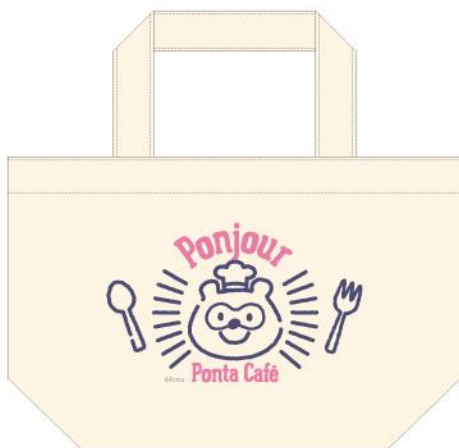
商品名：トートバッグ 価格：1,200 円(税抜)