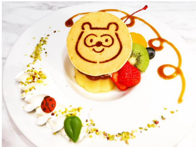
ポインタ de アラモード : 1,000円 (税抜)