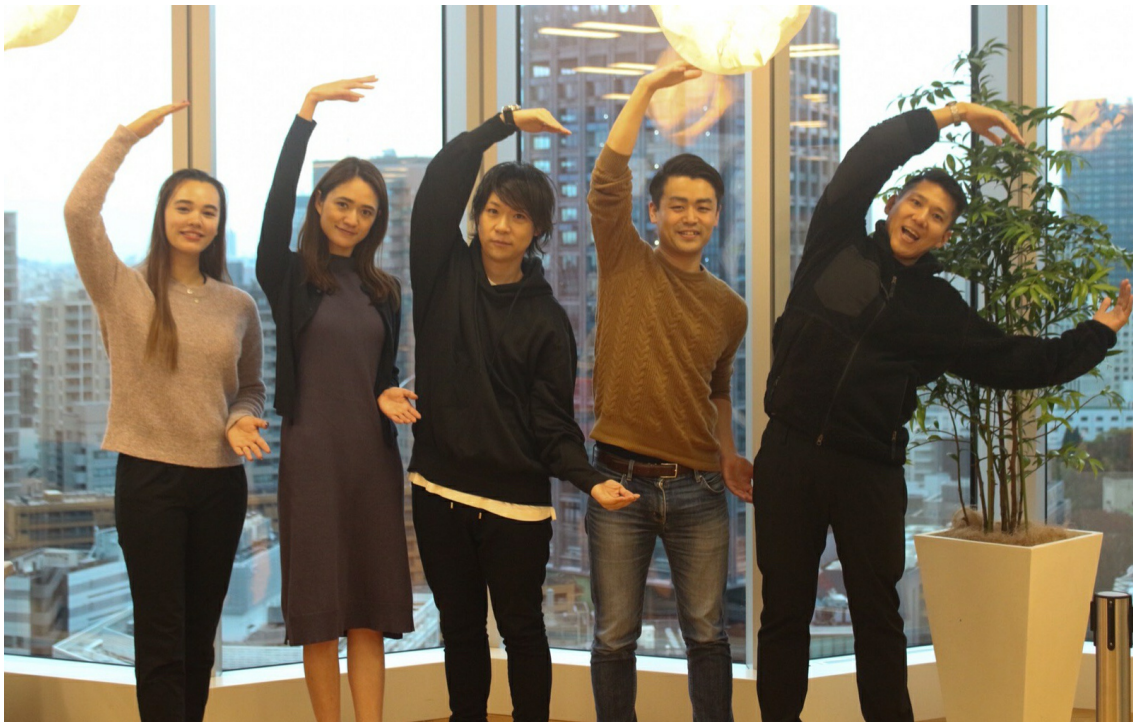
〈cookpyポーズで！：EastVentures × cookpy × YJキャピタル〉