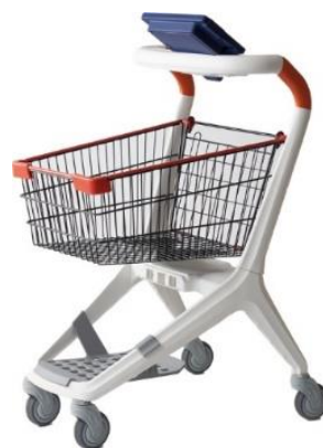
次世代モデル小型