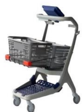
次世代モデル中型