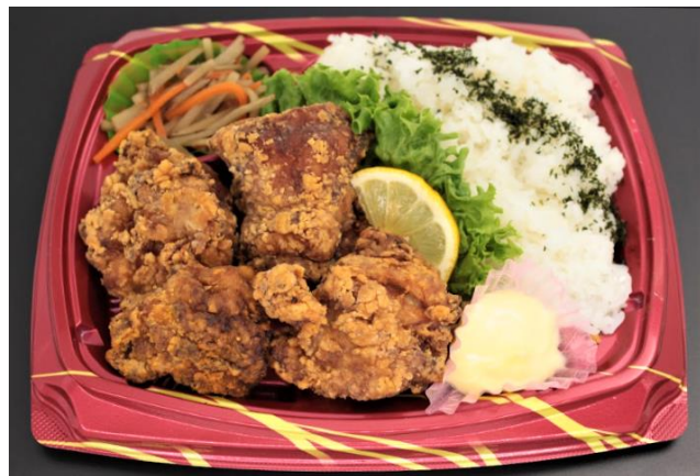
でっかい鶏ザンギ弁当