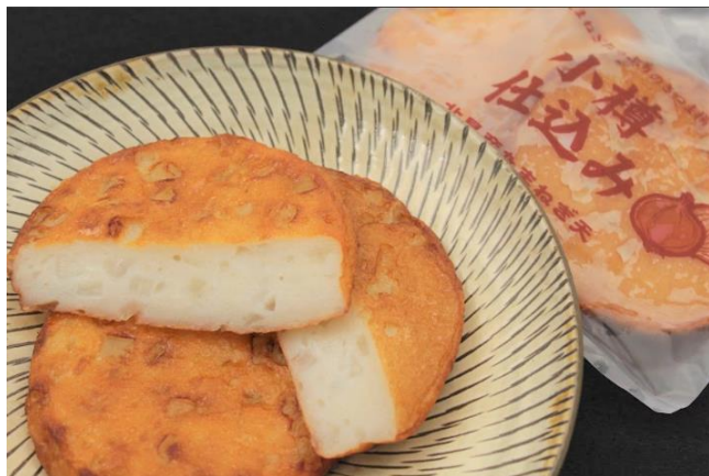
小樽仕込み北見産たまねぎ天

今後も TRIAL は、さらなる小売市場の変革を進め、全国各地のお客様の生活をより良いものにすべく、邁進してまいります。