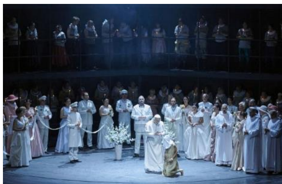
シュトゥットガルト州立歌劇場公演より

『ドン・カルロ』は、『椿姫』と同じくヴェルディを代表するオペラです。16世紀絶対王制時代のスペイン王朝を舞台とした歴史絵巻で、題名役のドン・カルロや、国王フィリップII世、王妃エリザベッタなど歴史上の人物が、リアルな人間ドラマを繰り広げます。今回は、シュトゥットガルト州立歌劇場との提携公演により、日本初演出となるロッセ・デ・ベアの格調高く、壮大な舞台が実現。欧州第一線で活躍するレオナルド・シーニの指揮にもご期待ください。