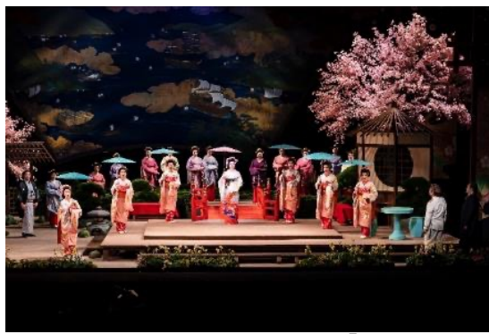
藤原歌劇団『蝶々夫人』より