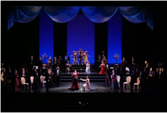
関西歌劇団『アドリアーナ・ルクヴルール』より