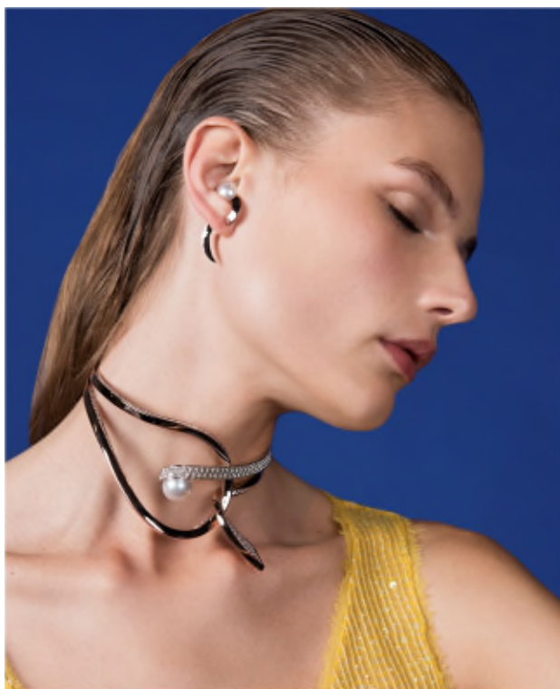
「Buoy (ブイ)」イヤリング ¥1,300,000 【18K SG、南洋真珠 白蝶】

TASAKI ならではのモダンなリュクスの世界を体現する「TASAKI Atelier」のファーストコレクションは、女性のコンテンポラリーアーティストたちの間で今再燃している「シュルレアリスム」の芸術運動にインスピレーションを得たものです。女性ならではのものの見方を強調した形で現在展開されているこの芸術運動の中で描かれる、たくましく鋭敏で知的な存在としての女性たちのために、TASAKI というジュエリーのルーツである真珠や海をモチーフに、身に着ける女性たちを一層輝かせ、エンパワーするような魅力に満ちたジュエリーが誕生しました。