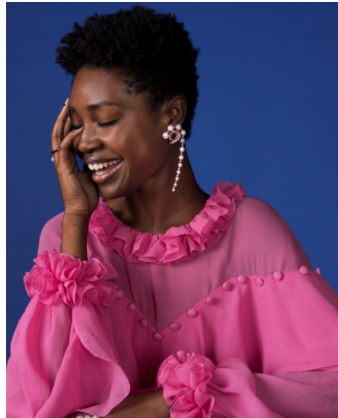
「Cove (コーヴ)」イヤリング ¥5,800,000