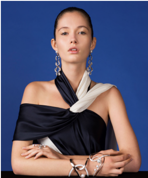
「Cascade (カスケード)」イヤリング ¥5,000,000

水のしずくが光を浴びて煌きながら流れ落ちるシーンを表現したデザインの「Cascade (カスケード)」。パールを育む入り江のフォルムをグラマラスに描き出し、動きにあわせてさらさらと揺れるフリンジが優しく寄せては返す波の煌きを想起させる「Cove (コーヴ)」。穏やかな海にゆったりと優雅に浮かぶ球体のブイ (浮標) をパールで表現した、革新的なデザインの「Buoy (ブイ)」。入り江の岩陰に現れた洞窟の内部を鮮やかに照らす直線的な光を表現した「Moulin (ムーラン)」。高いところからダイナミックに流れ落ちる滝にインスパイアされた「Waterfall (ウォーターフォール)」。パールを柔らかく包み込むように、海の中でオーロラのように煌く光を表現した、曲線がモダンで洗練された印象の「Aurora (オーロラ)」。真珠ならではの艶やかで神秘的な虹色の輝きをもたらす真珠層の、多面的な魅力に満ちた輝きをクリーンでオーガニックなラインで表現した「Nacreous (ナクレアス)」。