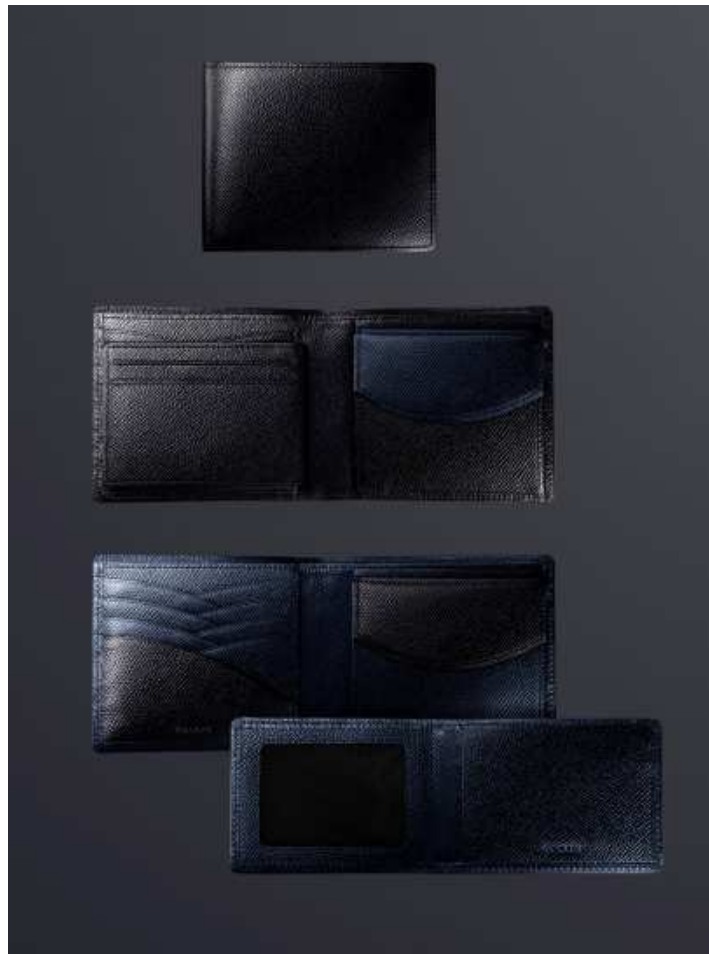
Men's small leather goods

And TASAKI will also launch series of small leather goods for men, which is the first men's leather items by TASAKI. TASAKI's distinctive leather pieces incorporate gentle curves reminiscent of the pearl, and the bi-colour detailing imparts an urban elegance and playfulness. TASAKI has striven for the perfect product in terms of the quality of the leather, the design and the functionality to create a line-up of ten items including a document holder, wallet, coin case, card case, and key holder in two different colours (black and navy).