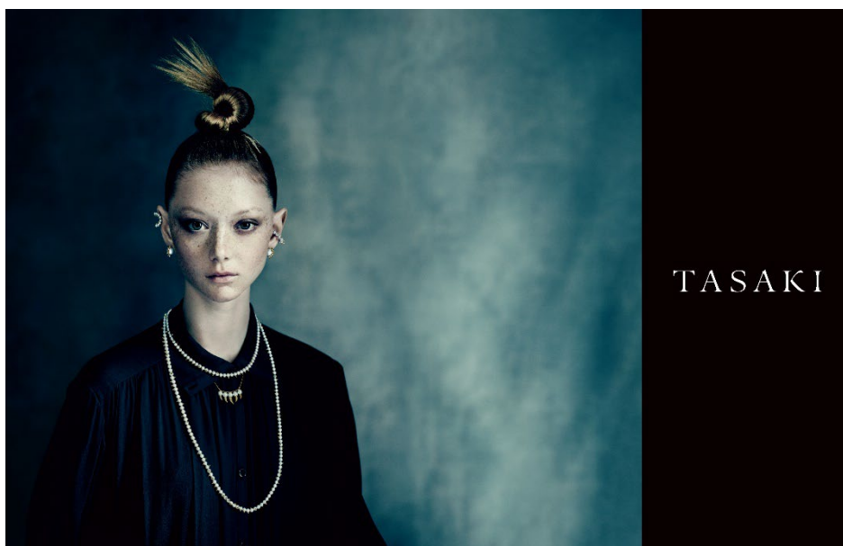
TASAKI COLLECTION LINE / danger series by Paolo Roversi ©TASAKI

TASAKI のアイコンシリーズ「デインジャー」に、重ねづけすることでより多面的な魅力が際立つ新作が登場します。パールひと珠ひと珠にゴールドのトゲをあしらった、ロングとショートのパールネックレスの重ねづけを主役に、エッジィでありながらロマンティックな「デインジャー」の魅力を余すところなく表現しています。新作イヤリングやイヤークフは、スタイリングの幅をさらに広がってくれます。新作は、2022年6月下旬より順次発売されます。