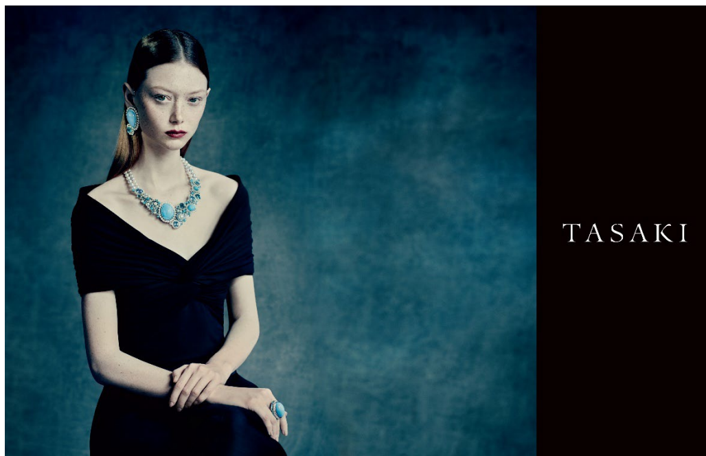
TASAKI Atelier / Radiant series by Paolo Roversi ©TASAKI

TASAKI Atelier の広告ビジュアルでは、TASAKI クリエイティブ ディレクター プラバル・グルン (Prabal Gurung) によるデザインの「ラディアント(Radiant)」シリーズをフィーチャー。その名のとおり、眩いばかりの輝きを放つこのジュエリーは、吸い込まれるような美しさの、無垢なブルーのターコイズが放つ魅惑的な美しさと艶やかなパールを用いて、移ろう雲の神秘的な姿を表現しています。美しい空と雲の色を描き出した3つのアイテムは2022年9月より展開されます。