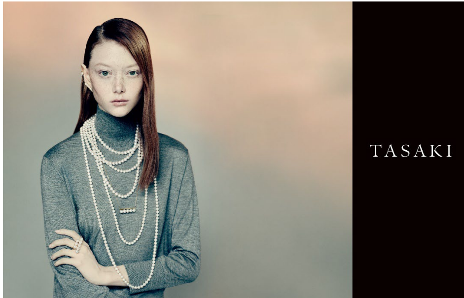
TASAKI COLLECTION LINE and pearl necklace / balance series by Paolo Roversi ©TASAKI

TASAKI ならではの遊び心とクラフツマンシップを体現するアイコンジュエリー「バランス」は、ブランドがパールを素材に表現してきた革新的デザインの象徴です。「バランス」とパールネックレスのコーディネートを通じて、TASAKI が大切にしてきた、“ひとりひとりが個性にあわせてパールジュエリーを楽しむこと”を、モダンかつファッショナブルに表現したビジュアルとなっています。