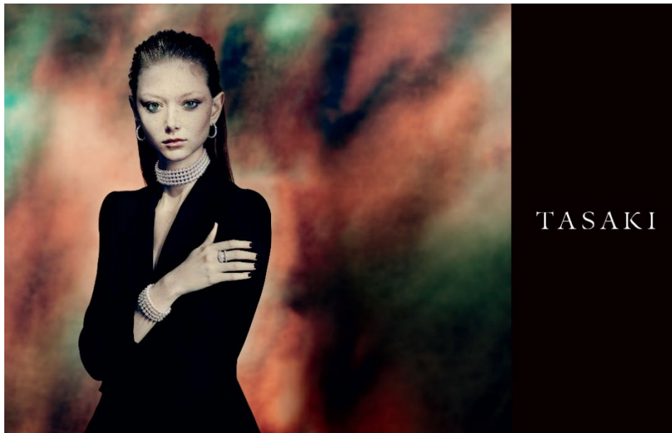
TASAKI COLLECTION LINE / danger series by Paolo Roversi ©TASAKI

エッジィでクール、かつラグジュアリーな「デインジャー」の新作ハイジュエリー。パールの4連ネックレスとブレスレットは、フロントにのみ「デインジャー」特有のトゲモチーフをあしらっており、エレガントな印象のパールからパンキッシュな魅力を引き出したデザインとなっています。ダイヤモンドの煌めきがラグジュアリーで幻想的な美しさを放つイヤリングとリングをコーディネートした、TASAKI ならではの魅力に満ちたスタイリングとなっています。新作は、2022年6月下旬より順次発売されます。