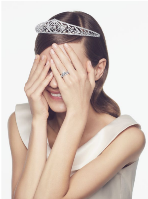
TASAKI 銀座本店にて抽選でレンタルしているスペシャルティアラのひとつ、「Sarah (サラ)」

「TASAKI ブライダルフェア」を通じて、ピュアな輝きを放つ TASAKI ダイヤモンドを最高のクリエイティビティとクオリティで仕上げたブライダルジュエリーの世界をご堪能ください。