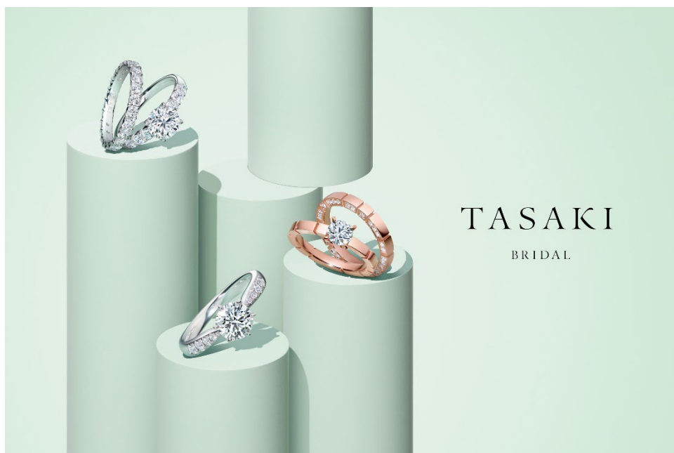
TASAKI ブライダルフェア キービジュアル (TASAKI Bridal 新広告ビジュアル)

また、TASAKI 銀座本店では、同店のみで展開するティアラ 4 種やご応募いただいた方の中から当選された方へ特別にお貸出しするスペシャルティアラもご用意しております。TASAKI の 2 大エレメントであるパールやダイヤモンドを華やかにあしらったモダンなデザインです。