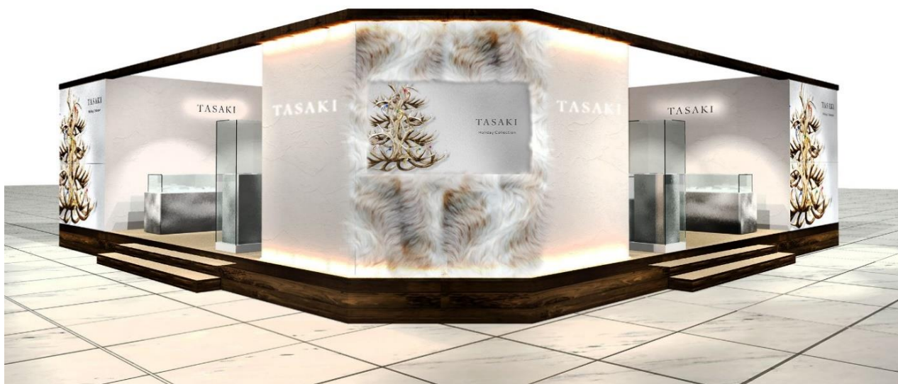
伊勢丹新宿店 本館1階 ザ・ステージで開催される TASAKI Holiday Collection POP-UP Store イメージ