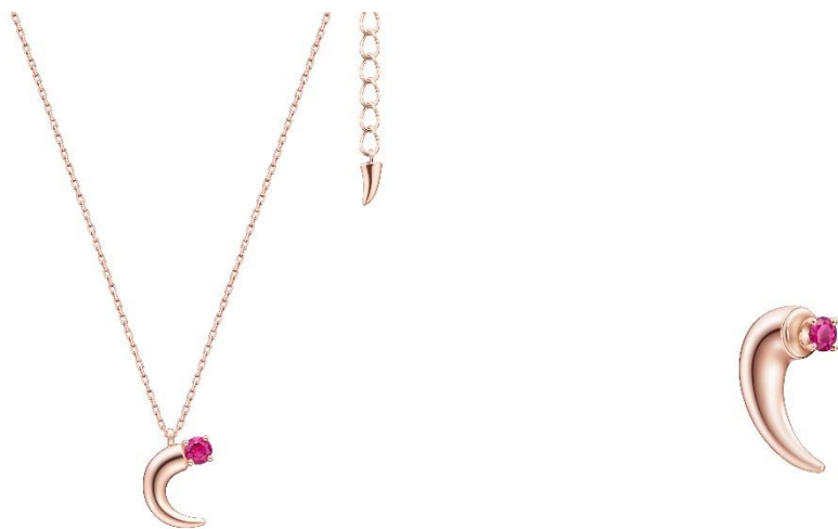
デインジャー ホーン ペンダント