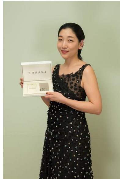
右) 安藤サクラさん 最優秀主演女優賞「怪物」、最優秀助演女優賞「ゴジラ-1.0」