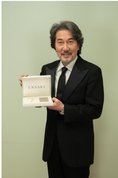
左) 役所広司さん 最優秀主演男優賞「PERFECT DAYS」