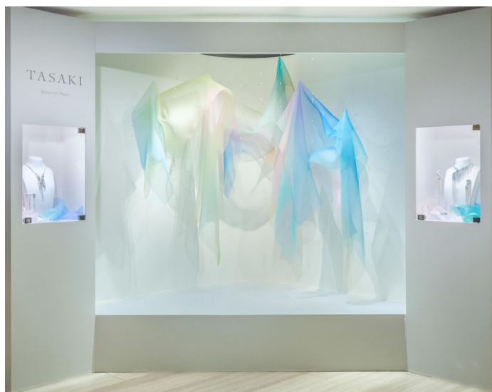
「オーロラのテキスタイル」