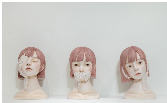
「See no evil, hear no evil, speak no evil.」

今回は、人形制作の手法で、より抽象的なアートピースとして制作したオブジェを展示する。