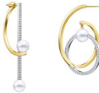
キネティック イヤリング

宇宙のエネルギーからインスピレーションを得て、星の巡りの美しさを表現した「kinetic（キネティック）」シリーズから、浮遊感あるパール遣いがモダンな新作イヤリングとペンダントが登場。クリーンなラインを描くゴールドと軽やかで優美なパールが美しいコントラストを表現しています。