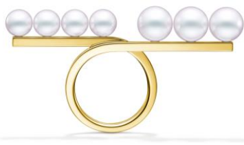
バランス ループ リング [18Kイエローゴールド、あこや真珠] ¥506,000

くると軽やかに指を取り巻くような流麗なラインを描くバーが特徴の新デザイン。バーの左右には、サイズの異なるパールが絶妙なバランスでセッティングされ、まるで1つの直線の上に並んでいるかのように見える、遊び心あふれるモダンなリングです。