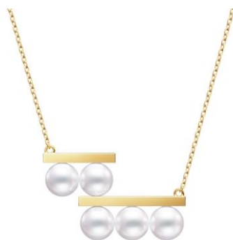
バランス ステップ ネックレス [18Kイエローゴールド、あこや真珠] ¥418,000

ステップ状になったバーに、パールが端正に並んでいる様は、まるでパールが美しいステップを軽やかに踏んでいるかのよう。遊び心溢れる新たなデザインで、「balance」のモチーフならではの浮遊感をユニークかつフレッシュに表現したネックレスとイヤリングとなっています。