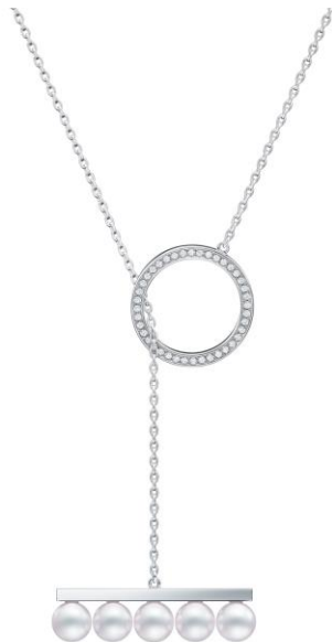
バランス ディヴァイン ダイヤモンド パヴェ ペンダント [18K ホワイトゴールド、あこや真珠、ダイヤモンド] ¥671,000

「balance divine (バランス ディヴァイン)」のジュエリーに、TASAKI の 2 大エレメントであるパールとダイヤモンドをホワイトゴールド台にあしらったペンダントが登場します。胸元にも背中にも身に着けられるセンシュアルなデザインが洗練された輝きを放つジュエリーです。