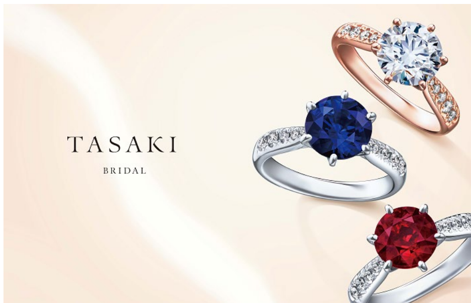
TASAKI 銀座本店にて先行発売される、サファイア（中央）、ルビー（下）をセッティングした「PIACERE（ピアチェーレ）」

「TASAKI ブライダルフェア」を通じて、ピュアな輝きを放つ TASAKI ダイヤモンドを最高のクリエイティビティとクオリティで仕上げたブライダルジュエリーの世界をご堪能ください。