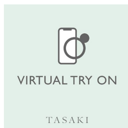
TASAKI VIRTUAL TRY ON ロゴ

また、「デインジャー」シリーズのアイコンジュエリーをオンラインで試着できる「VIRTUAL TRY ON」コンテンツがTASAKI公式ウェブサイトスタートいたします。人気の高いシリーズのリングやイヤリングを、スマートフォンとAR技術（Augmented Reality=拡張現実）を使って、オンライン上でお試しください。ただけるARで、時間や場所を選ばず気軽にTASAKIのジュエリーをお楽しみいただける新たなサービスとなっております。