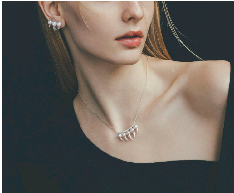
デインジャー ファンク イヤリング（片耳用） [18K ホワイトゴールド、あこや真珠、ダイヤモンド] ¥341,000 デインジャー ファンク ダイヤモンド パヴェ ネックレス [18K ホワイトゴールド、あこや真珠、ダイヤモンド] ¥1,001,000

食虫植物や自然界に生息する生き物などの神秘的なフォルムの美しさをモチーフとする「danger」シリーズの新作はファンク（牙）やクロウ（かぎ爪）をモチーフにしたジュエリーです。シンプルな中にもパワフルで野性的なシャープさを感じさせるデザインで、ネックレスの他、イヤークフやイヤリング、リングが登場いたします。