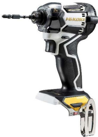
WH 36DC(NNWG) ホワイト&ゴールド