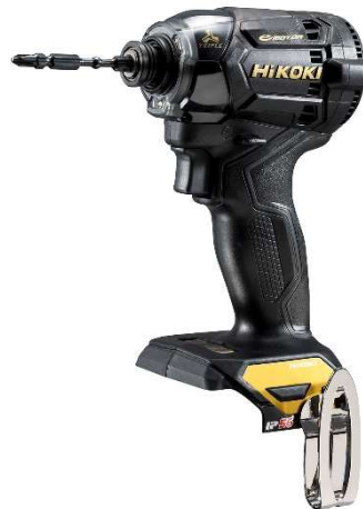
WH 36DC(NNBG) ブラック&ゴールド