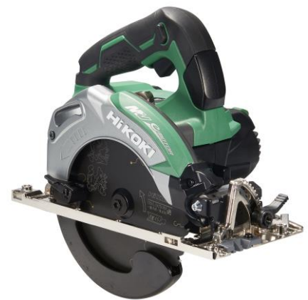
黒鯨標準付属モデル 丸のこ C3606DA

チップソーは、木材の切断等を行う電動工具「丸のこ」に使用する円盤状の刃物の一種です。「スーパーチップソー黒鯨」は、従来品 ※1 に比べ刃数を減らし、刃の角度を鋭利にすることで“鋭い切れ味”を実現しています。さらに、組刃 ※2 のセット数を増やしたことにより“長切れ” ※3 も実現しました。