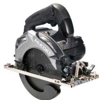
ストロングブラック