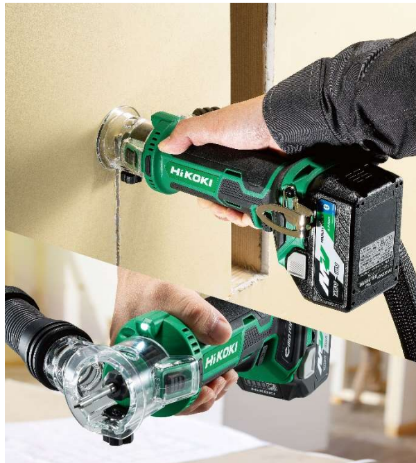
当製品の作業イメージ

フリーダイヤル(無料):0120-20-8822 市外局番(有料):03-5539-0253