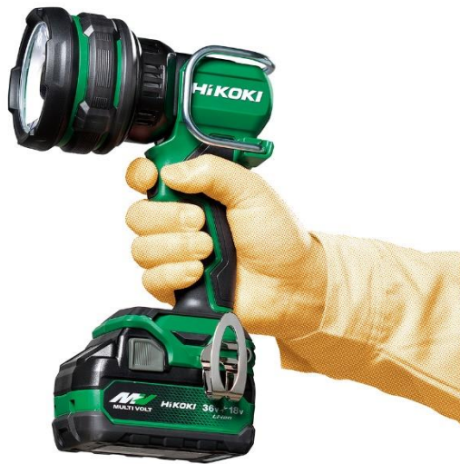
当製品の作業イメージ

工機ホールディングスジャパンはこれからも、販売パートナーのみなさまとともに、お客さま視点に立ったより良い製品の開発とサービスの向上に努め、販売パートナーのみなさまおよびお客さまへの信頼に応えていきます。