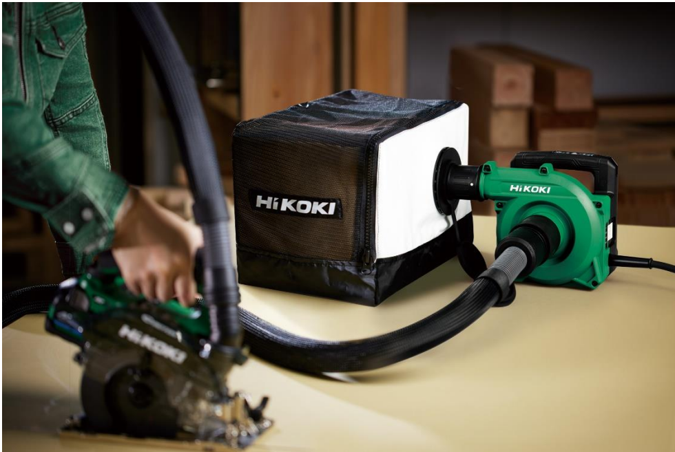
当製品の作業イメージ

工機ホールディングスジャパンはこれからも、販売パートナーのみなさまとともに、お客さま視点に立ったより良い製品の開発とサービスの向上に努め、販売パートナーのみなさまおよびお客さまへの信頼に応えていきます。