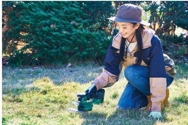
当製品の作業イメージ

工機ホールディングスジャパンはこれからも、販売パートナーのみなさまとともに、お客さま視点に立ったより良い製品の開発とサービスの向上に努め、販売パートナーのみなさまおよびお客さまへの信頼に応えていきます。