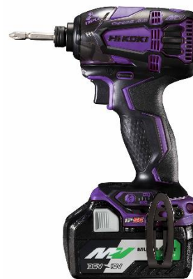
プレミアムパープル&ブラック