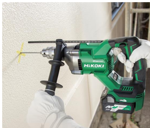
当製品の作業イメージ

工機ホールディングス株式会社 お客様相談センター Tel: 0120-20-8822