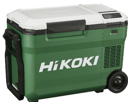
UL 18DB(M) アグレッシブグリーン