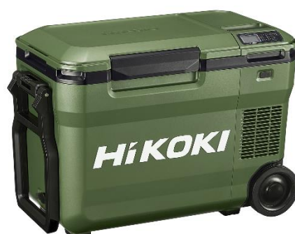
UL 18DB(MG) フォレストグリーン