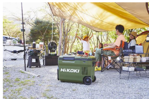
当製品の作業イメージ