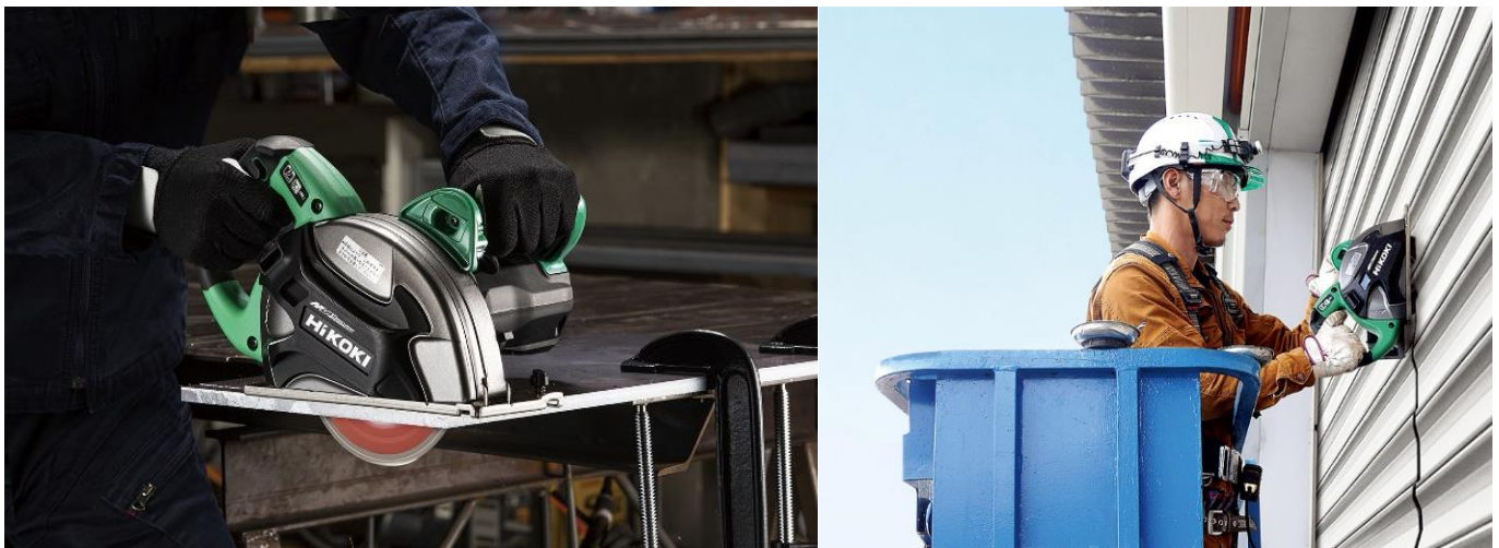
当製品の作業イメージ