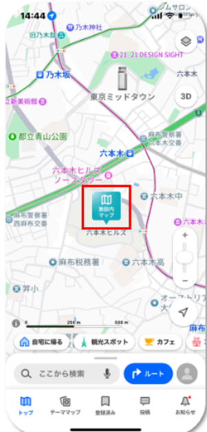
マップ上に施設内マップのアイコンを表示