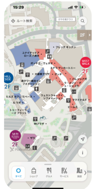
施設内マップにスムーズに切替表示

Map data © Mapbox © OpenStreetMap © ZENRIN © LY Corporation © Boldright