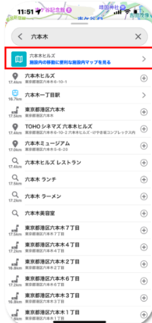
キーワード検索時に近くの施設内マップを表示