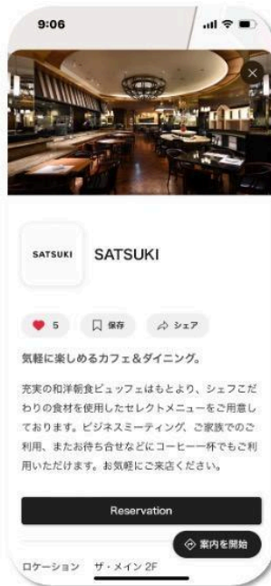
ホテルニューオータニ 施設内の各店舗詳細表示