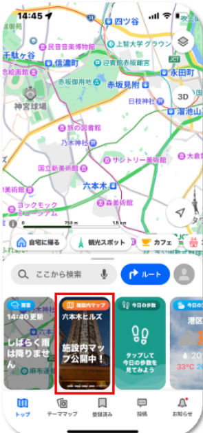
スワイプすると施設内マップのカテゴリを表示