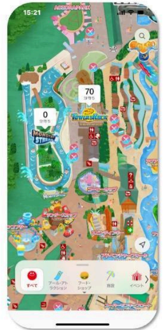
東京サマーランド アトラクションの待ち時間表示