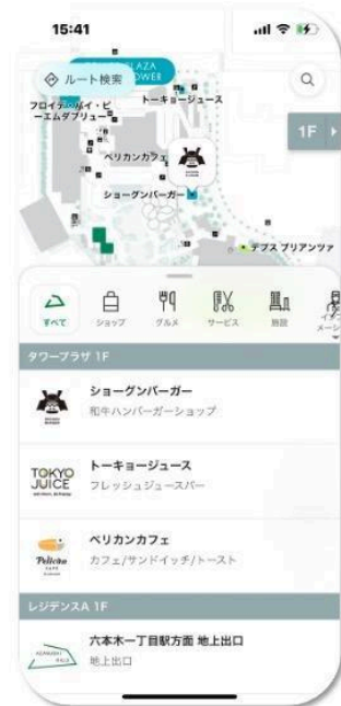
麻布台ヒルズ 施設内のリスト表示