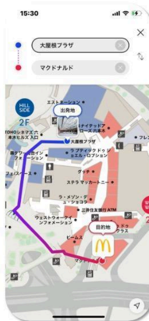
六本木ヒルズ 施設内経路検索