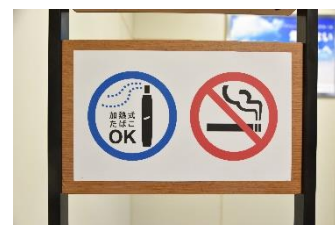
加熱式たばこ専用エリア内のパネル