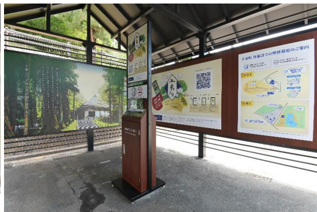
<毛越寺 町営駐車場 休憩所内:外観>