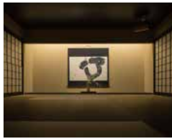
Tatami Salon 精神をリラックスさせる大きな畳の部屋