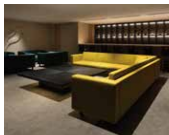
ラウンジ 時間帯で軽食やお茶菓子、アルコールをご用意