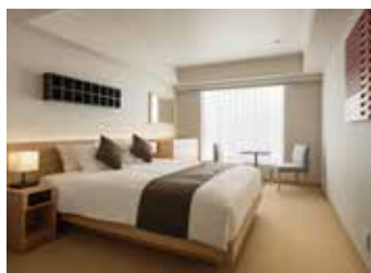
SUPERIOR QUEEN (約24㎡)