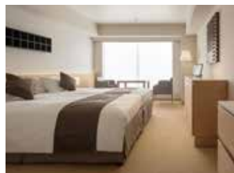
ENSO TWIN WITH KITCHEN (約32㎡)