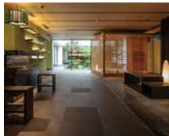
茶室・立札 和のおもてなし茶道