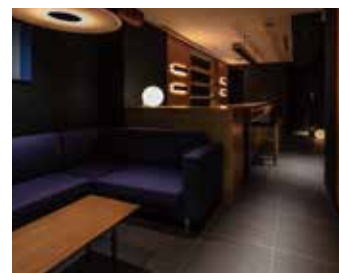
バー 京都の繁華街「祇園」に位置している