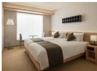
SUPERIOR TWIN (約24㎡)