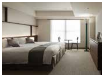
ENSO TWIN (約28㎡)