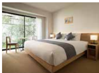
SUPERIOR KING (約24㎡)