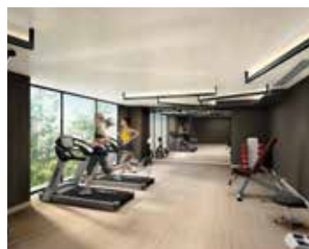
ジム ニーズに合わせたエクササイズが可能