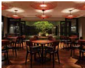
レストラン/バー スペイン料理と地産食材を融合したメニューをご用意