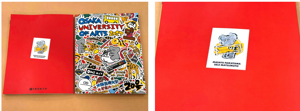
裏表紙には中山さんによる『ねずみのANDY』が描かれている