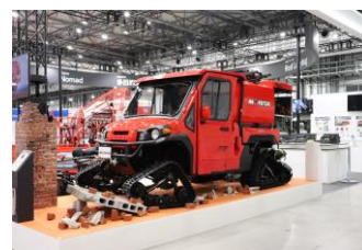
小型オフロード車 Red Ladybug

当コンテストもこれらの活動の一環として、お子様の豊かな想像力を育むことを目的にスタートしました。ぜひ夢いっぱいの「未来の消防車」を描いてみませんか。アイデア豊富で夢のある作品のご応募をお待ちしております。