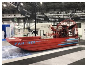
救助用エアボート FAN-BEE