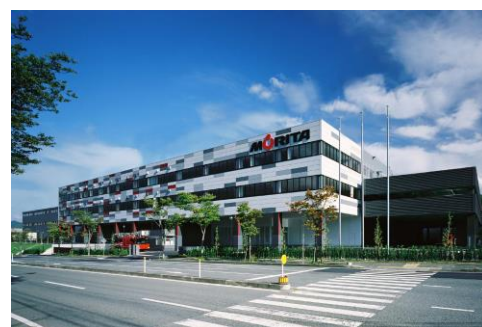
モリタ三田工場(兵庫県三田市)

最優秀賞に選ばれたお子様はモリタオリジナルグッズプレゼントのほか、株式会社モリタ さんだ 三田工場(兵庫県三田市 さんだ )へご招待いたします。このモリタ さんだ 三田工場は日本最大の消防車製造工場で、国内の消防車の過半数がこの工場 さんだ で誕生しています。