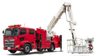
21m ブーム付多目的車 MVF21

モリタグループは1907年の創業から「人と地球のいのちを守る」をスローガンに、安全で住みよい豊かな社会づくりに取り組んでまいりました。近年では、多様化する火災現場で対応可能な「21mブーム付多目的消防ポンプ自動車 MVF21」に加え、増加する大規模水災害で安全に救助活動を行える「救助用エアボート FAN-BEE(ファンビー)」や、高い走破性を備えた「小型オフロード車 Red Ladybug(レッドレディバグ)」などの開発を通じて私たちの思いをお伝えしてまいりました。