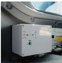
【制御BOX】 運転席後部に取付