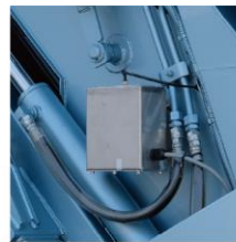
【噴霧装置】 テールゲート 側部に取付