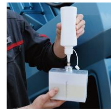
【香料タンク】 容量 200ml で 簡単操作で詰替え