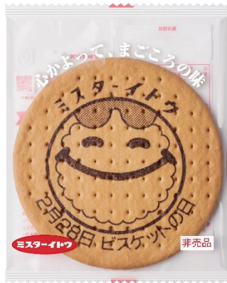
でかビスケット(でかビス)