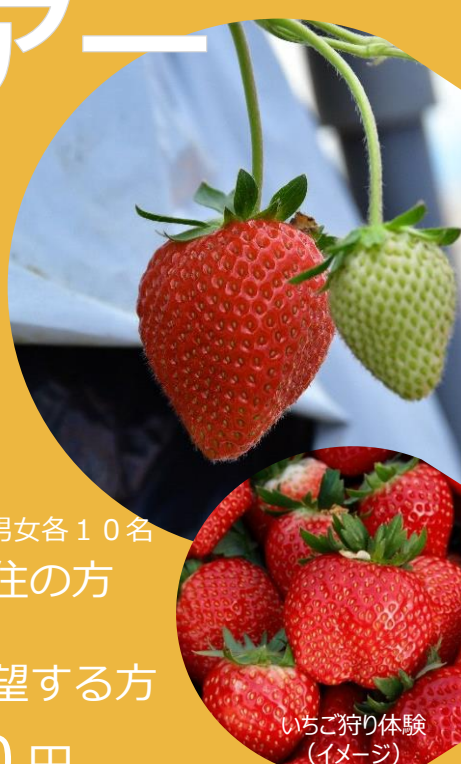
いちご狩り体験 (イメージ)