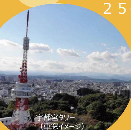
宇都宮タワー (車窓イメージ)