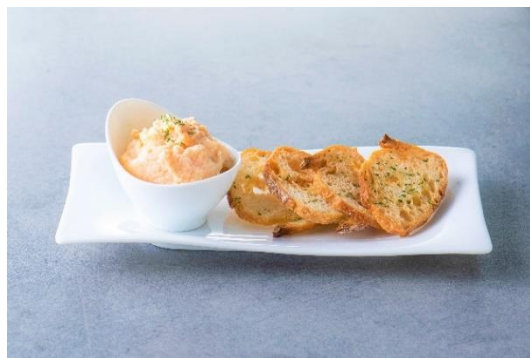
タラコのポテトサラダメルバトースト 添え ¥500