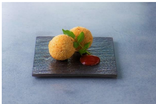
松坂牛入り一口メンチカツ ¥500

地上134mからの絶景もおつまみに、お客さまのご都合にあった時間とスタイルで、ちょっと優雅な“My Time”を自由にカスタマイズしてお楽しみください。座席はソーシャルディスタンスを十分に保ち、「安心・安全」を最優先にご案内いたします。