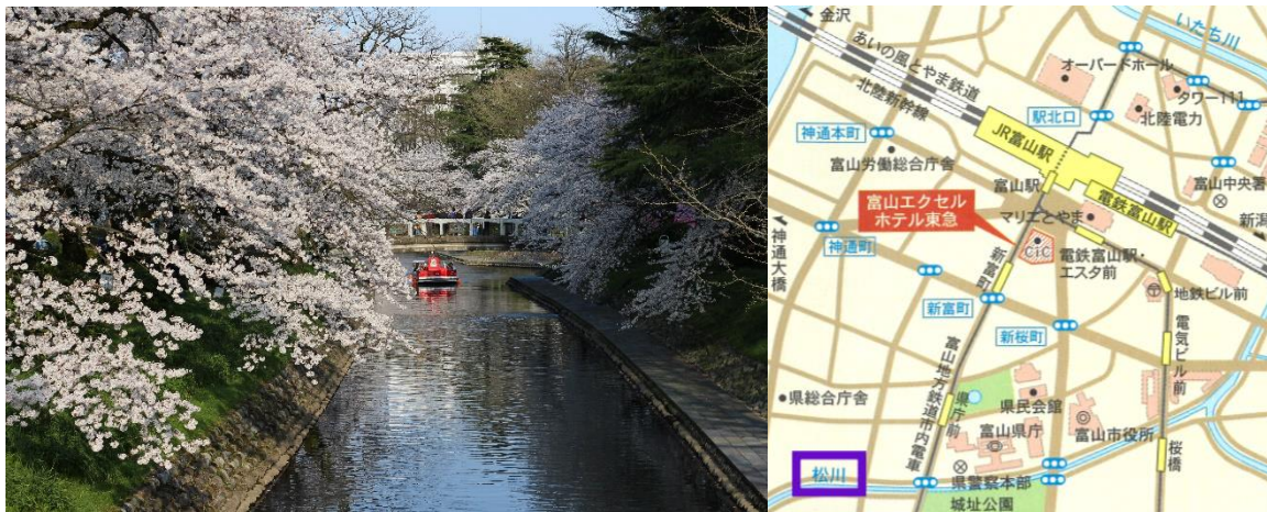
松川べり 満開の桜と遊覧船

第1回目の清掃活動は、ホテルから徒歩5分程度にある、「さくら名所100選」の松川べりの遊歩道で行います。この遊歩道は、お花見シーズンでは桜のトンネルをくぐりながら散策を楽しめるので、昼夜問わず多くの方がお越しになります。遊覧船も運行されており水上から兩岸の桜を楽しむこともできます。